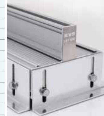
Lüftungsschiene LS 1-schlitzig

Die technischen Daten beziehen sich auf: Hallentemperatur 30 °C / Luftfeuchtigkeit 60 – 80% / Beckenwassertemperatur 27 – 28 °C, * Umluft 30 °C / 60% r.F., ** Außenluft a) nach VDI 2089 b) bei + 8 °C c) bei - 5 °C