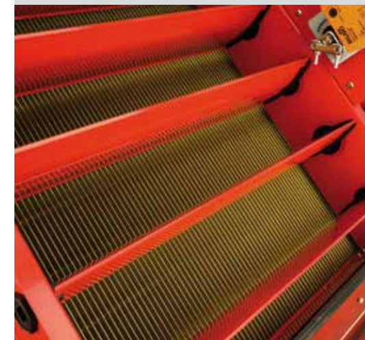
Hochleistungsrekuperator mit Sommer-Bypass

* Die technischen Daten beziehen sich auf: Hallentemperatur 30 °C / Luftfeuchtigkeit 60 – 80% / Beckenwassertemperatur 27 – 28 °C, Außenluft 8 °C / 80%