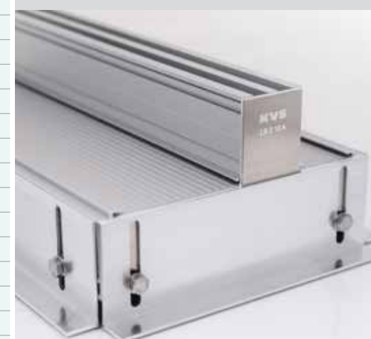
Lüftungsschiene LS 2-schlitzig