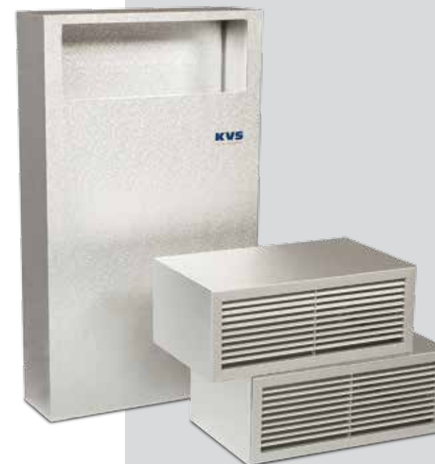
Kanalverlängerungsstück und Wanddurchführungen mit Lüftungsgittern